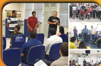
Seeb/MT preparando a Campanha Nacional dos Bancários 2018