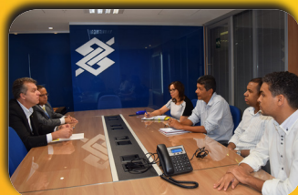
Direção do Seeb/MT reúne-se com Superintendência do BB após denúncias