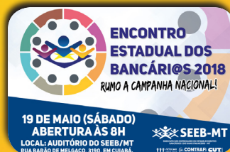
Seeb/MT realizará Encontro Estadual dos Bancários dia 19 de maio