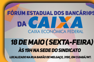
Seeb/MT convoca Fórum Estadual dos Bancários e Bancárias da CAIXA